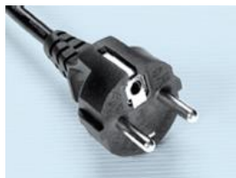
EURO plug 220-240 volt EURO prise 220-240 volts