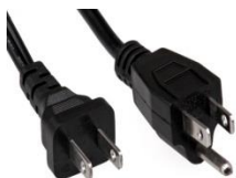
USA plug 110-120 can also be used in JAPAN USA bouchon 110-120 peut également être utilisé au Japon.